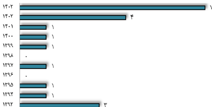
شکل ۳. روند زمانی پژوهش‌های توانمندسازی زنان در صنعت گردشگری و مهمان‌نوازی ایران؛ منبع: یافته‌های پژوهش

یکی از مهم‌ترین موارد در مرور سیستماتیک، دسته‌بندی موضوعی مطالعات در حیطه مورد نظر است. بررسی مطالعات توانمندسازی زنان نشان می‌دهد که می‌توان این مطالعات را در پنج خوشه اصلی دسته‌بندی نمود.